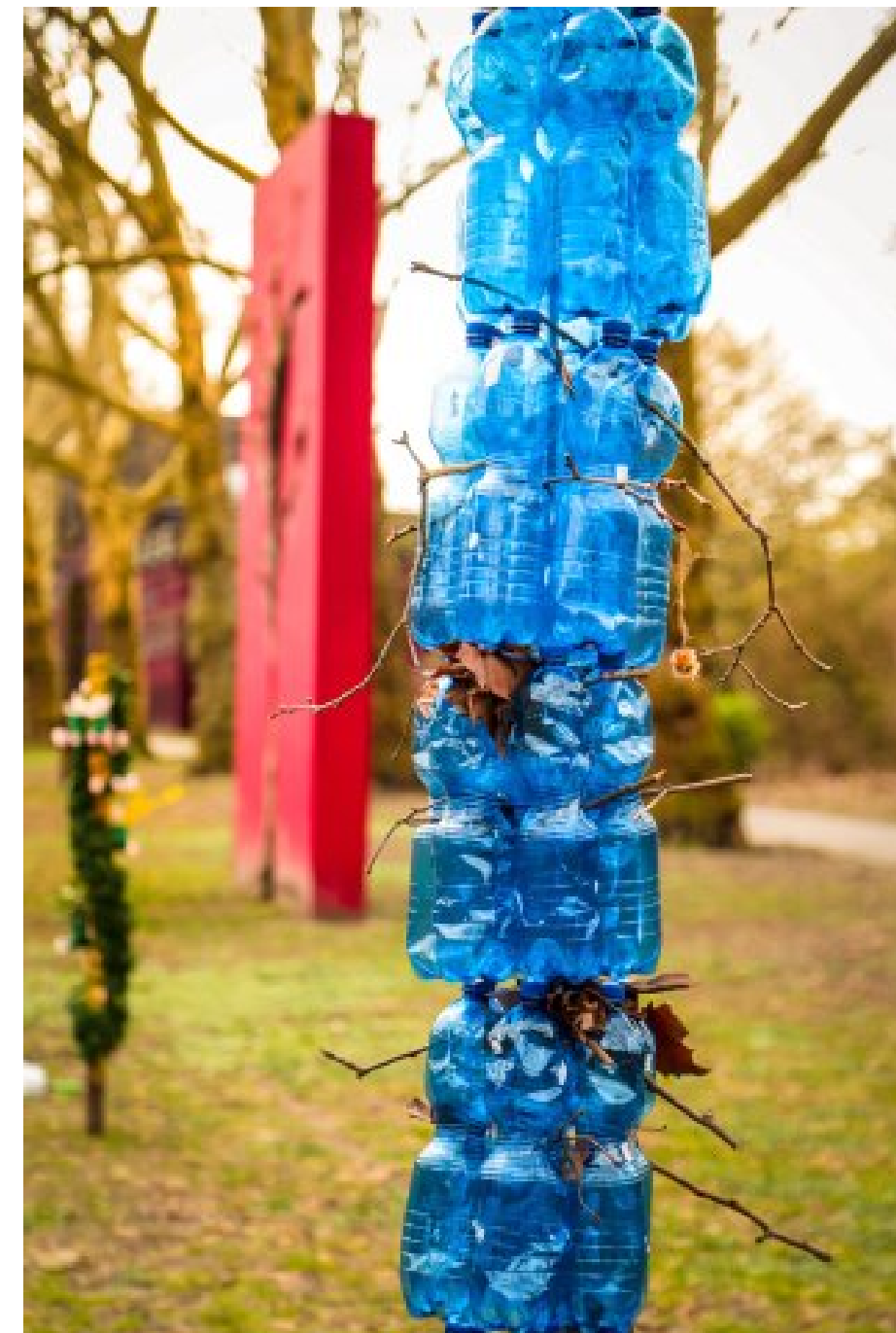
Aus blauen Plastikflaschen bauten die Schüler ein bereits wieder abgebautes Originalkunstwerk nach. Damit machten sie auf das Thema Plastikmüll aufmerksam.