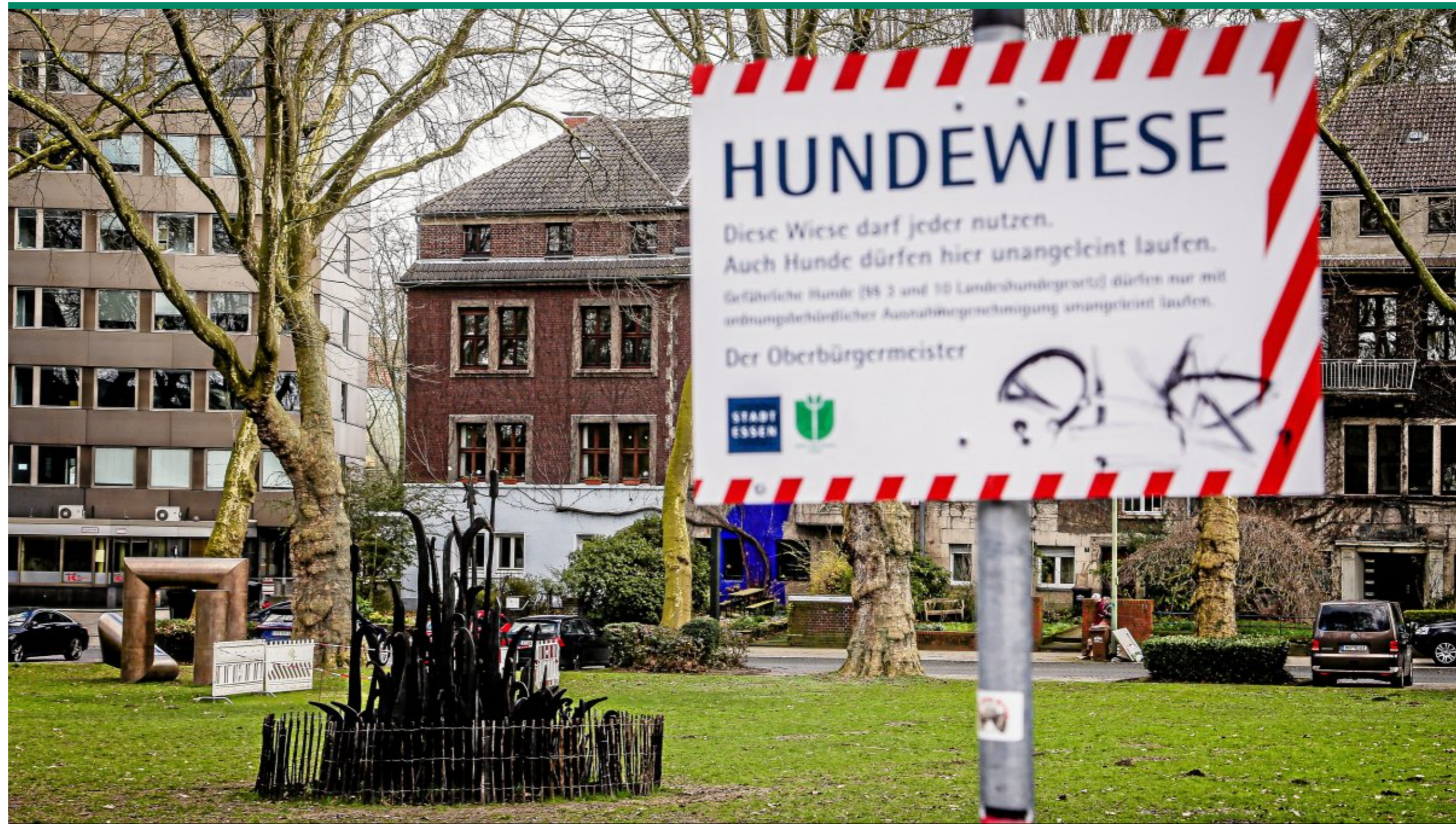
Am Moltkeplatz in Essen werden die Hinweisschilder demnachst wohl abgeschraubt. Das Burgerbegehren zum Erhalt der Hundewiese ist gescheitert. Foto: Andre Hirtz / FUNKE Foto Services

08.08.2023, 11:15 | Lesedauer: 2 Minuten Gerd Niewerth