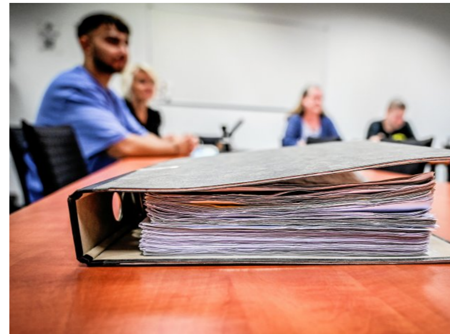
Diesen Ordner mit Unterschriften ubergaben die Initiatoren des Burgerbegehrens Hundewiese dem Wahlamt zur Prufung.